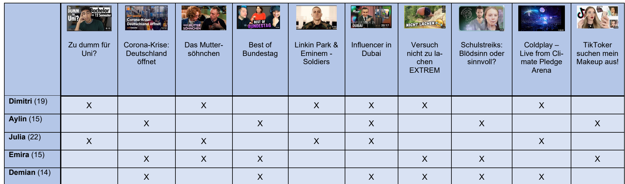
Tabelle 1: Aufgerufene Videos

Wie lässt sich diese Videoempfehlung des Algorithmus erklären?